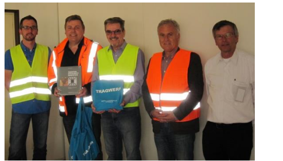
(Text/ Bilder: Dipl.-Ing.(FH) Bernhard Schönmaier M.Eng.)