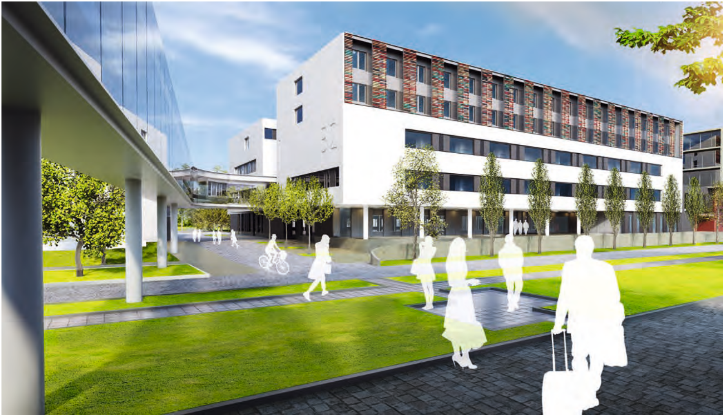
Chirurgische Notaufnahme und OP-Zentrum Universitätsklinikum Dresden