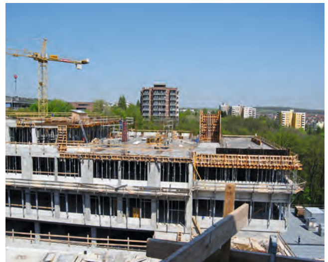
Innere Medizin der Uniklinik Würzburg