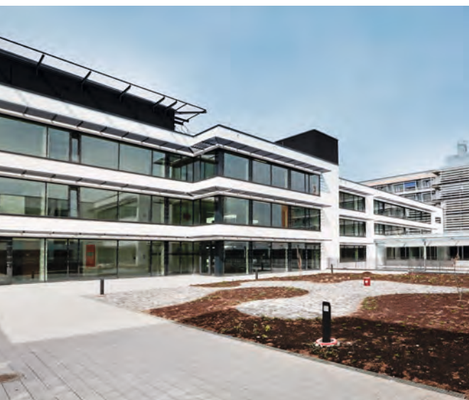
BKH und Klinikum Kempten