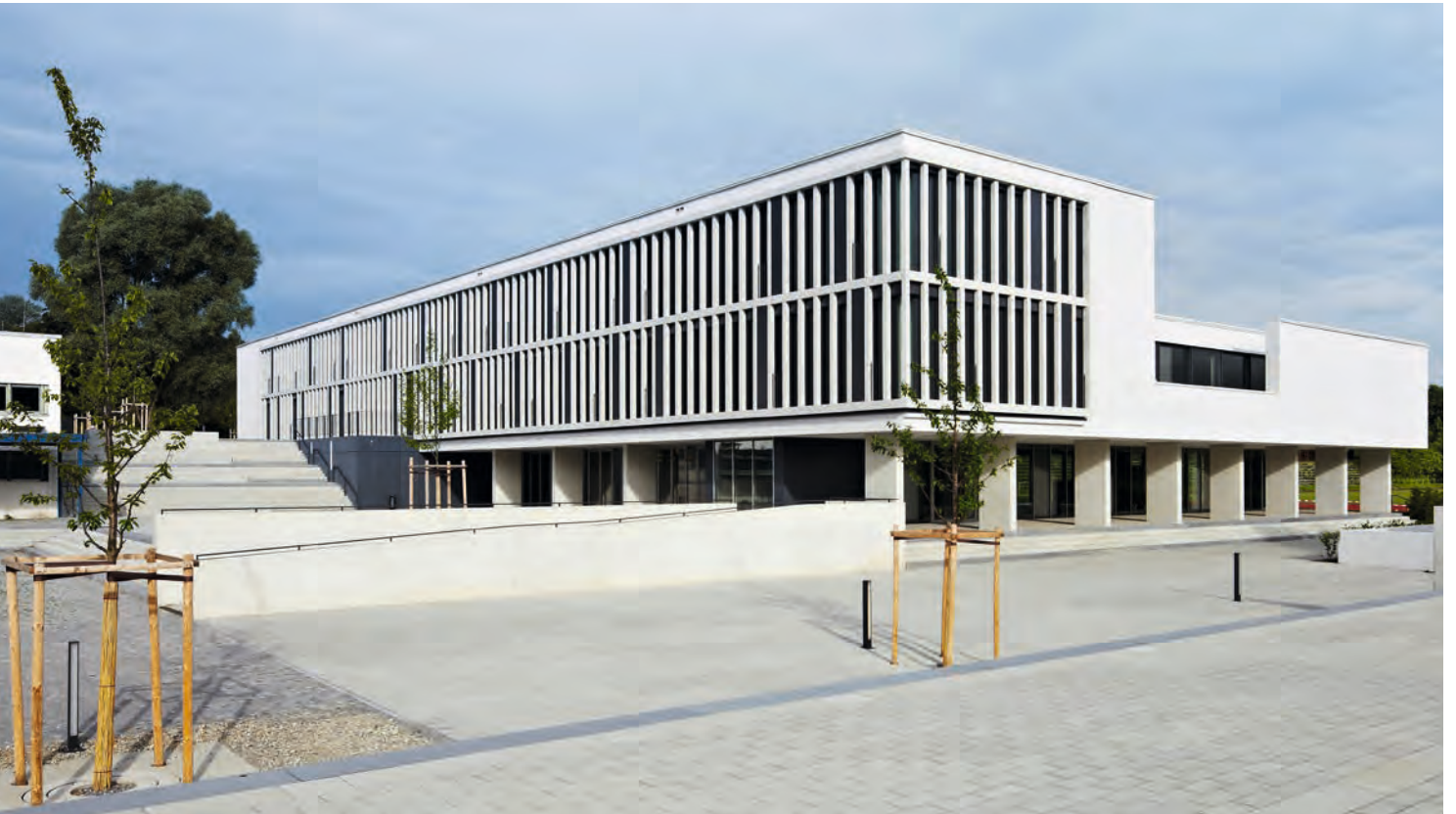
Camerloher Gymnasium Freising